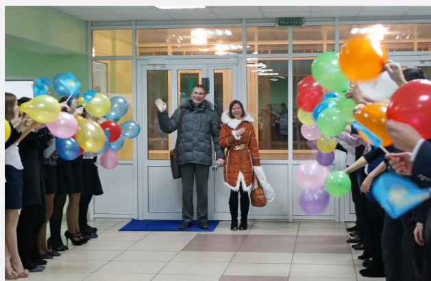
Торжественная встреча призера Евразийской олимпиады