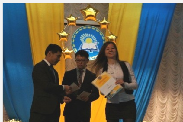
1 место в области!