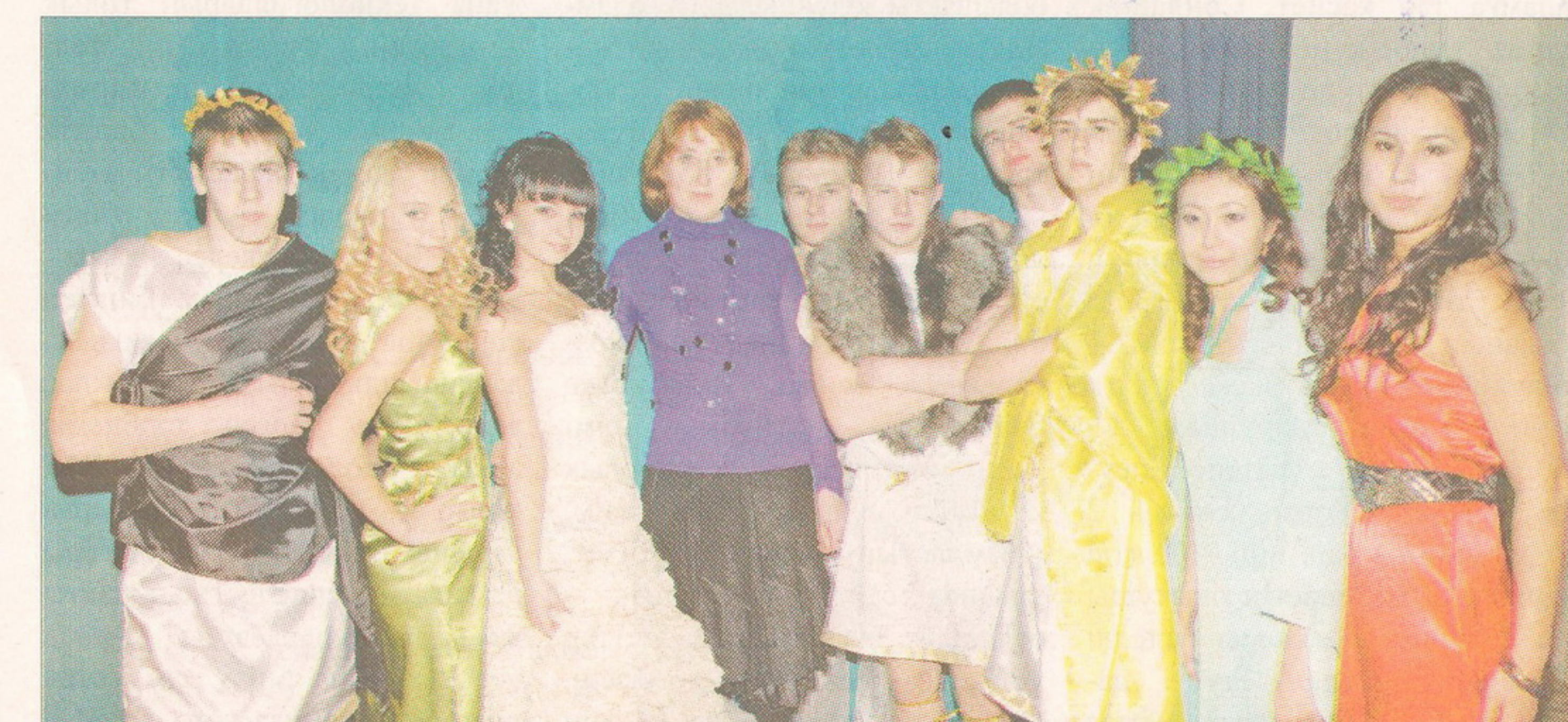
▲ К празднику готовы!

– Мне нравится, как одеваются женщины у нас в Костанайе – красиво, эффектно. Бывает, конечно, и перебор, но в большинстве все же наши девушки и дамы очень нарядные и ухоженные. Наверное, это и дает мне, нашему театру моды стимул придумывать новые интересные коллекции, которые радуют и удивляют зрителей.