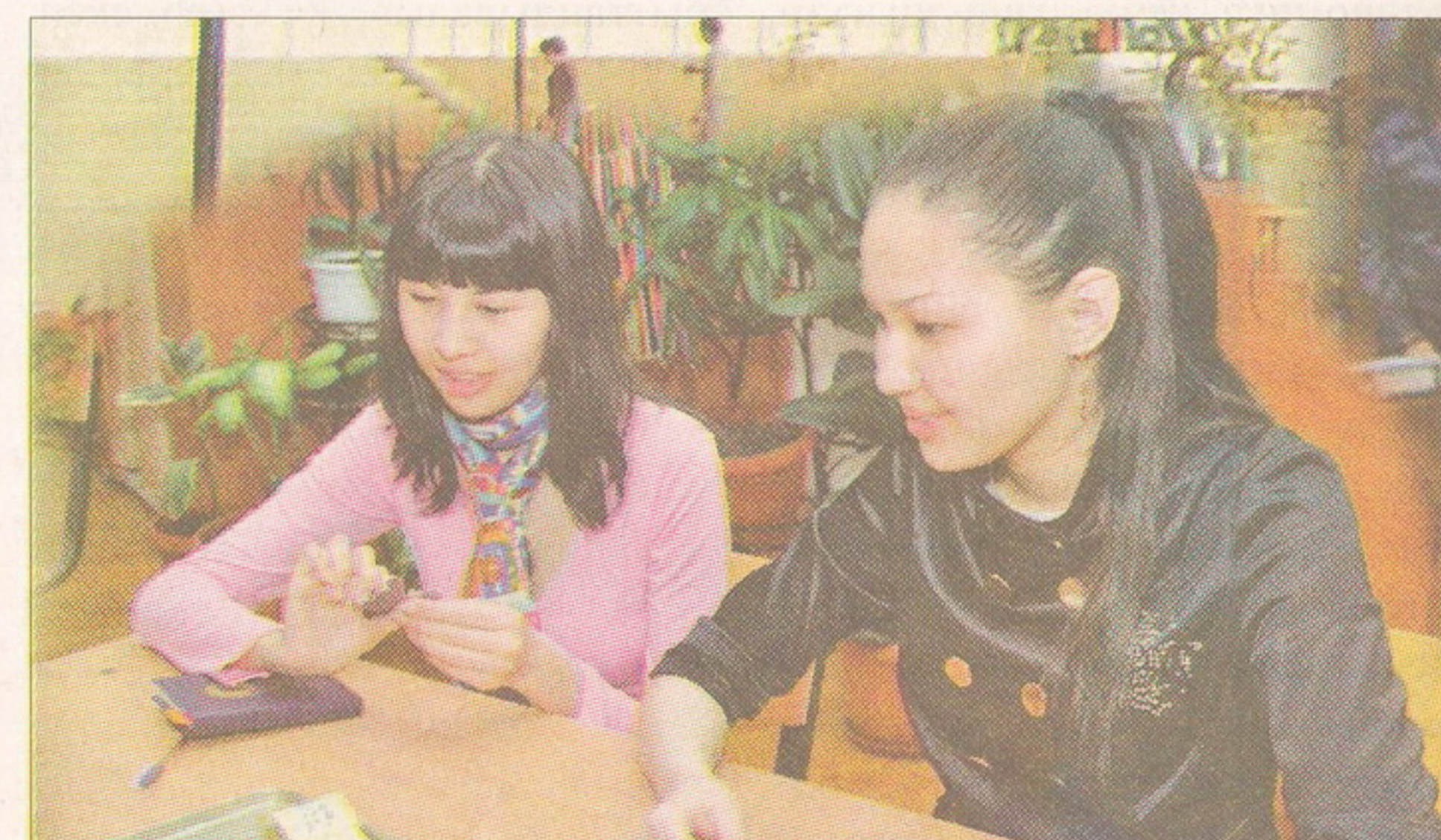
▲ Девочки с увлечением занимаются в театре моды