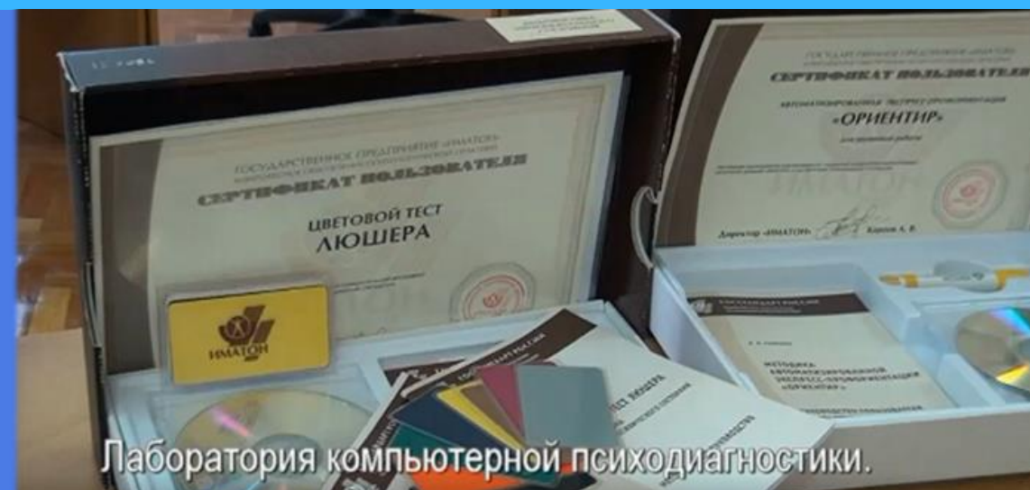
Лаборатория компьютерной психодиагностики.